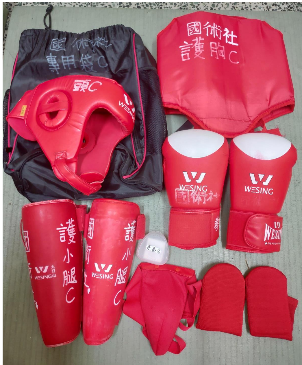
護具C: 專用袋C, 護頭C, 牙套C, 護胸C, 拳套C*2, 護襠C, 護小腿C*2, 護腳背C*2