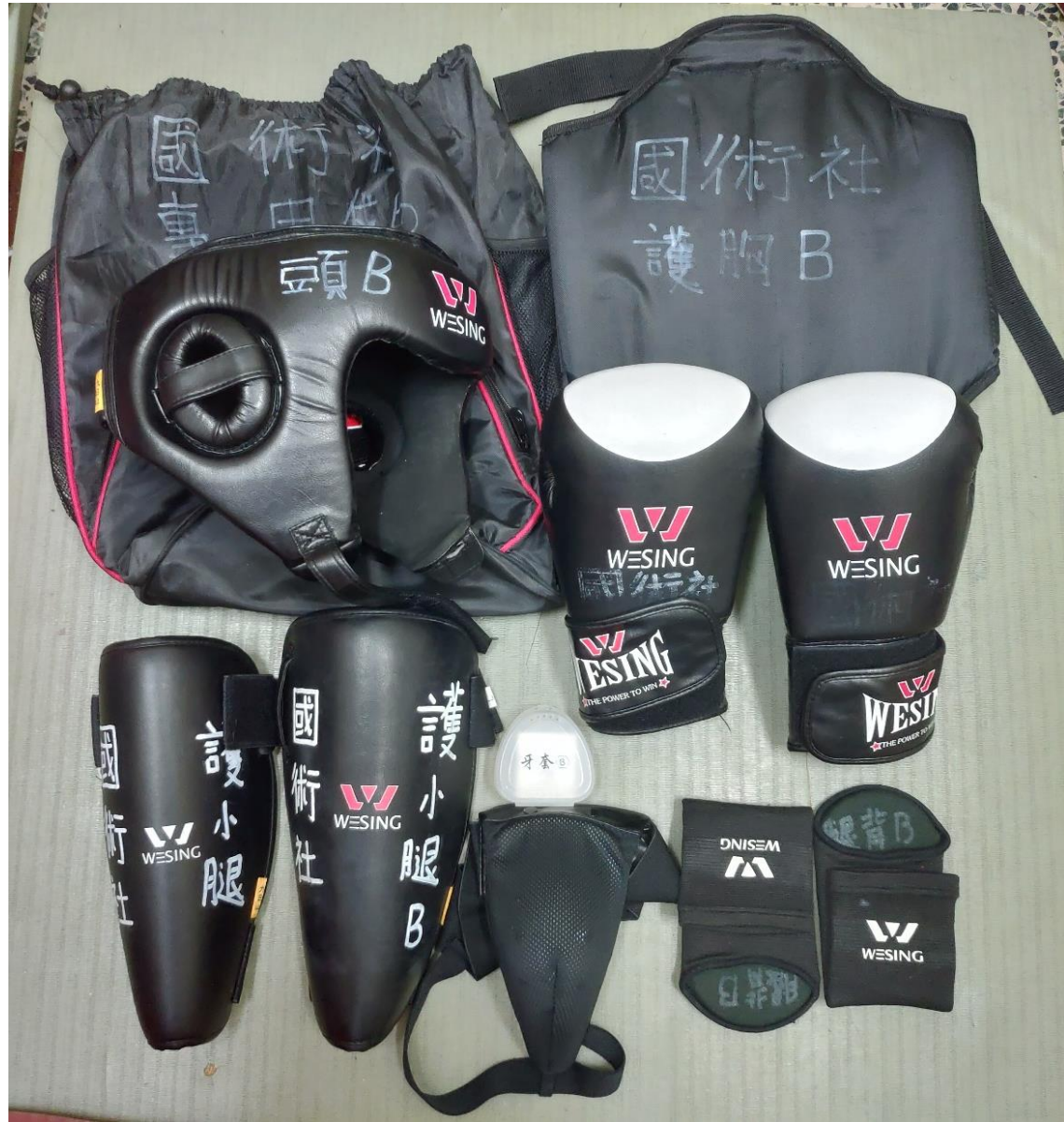
護具B: 專用袋B, 護頭B, 牙套B, 護胸B, 拳套B*2, 護襠B, 護小腿B*2, 護腳背B*2