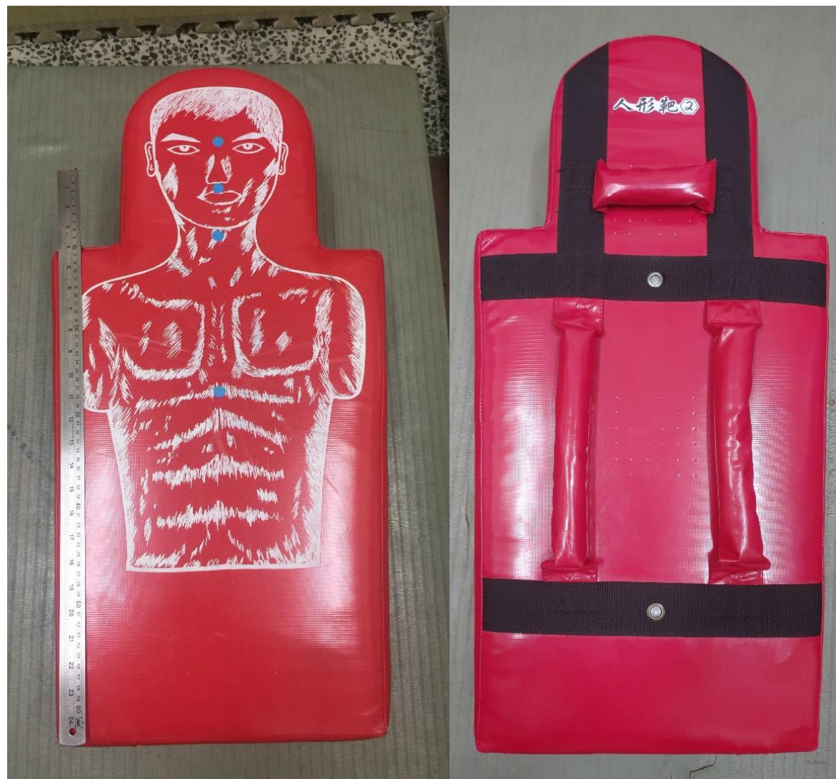
人型靶 2 (正、反面)