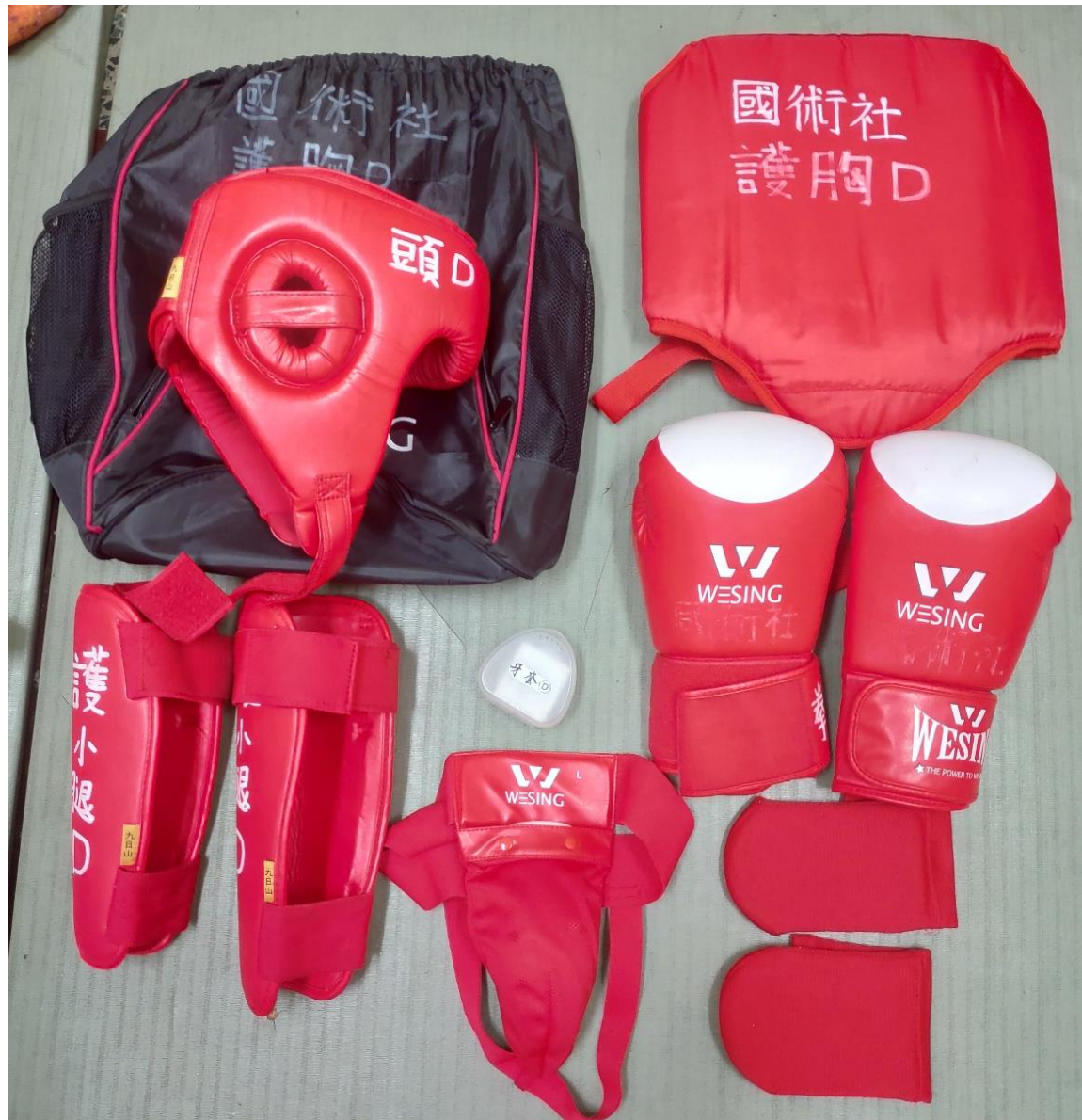
護具D: 專用袋D, 護頭D, 牙套D, 護胸D, 拳套D*2, 護襠D, 護小腿D*2, 護腳背A*2