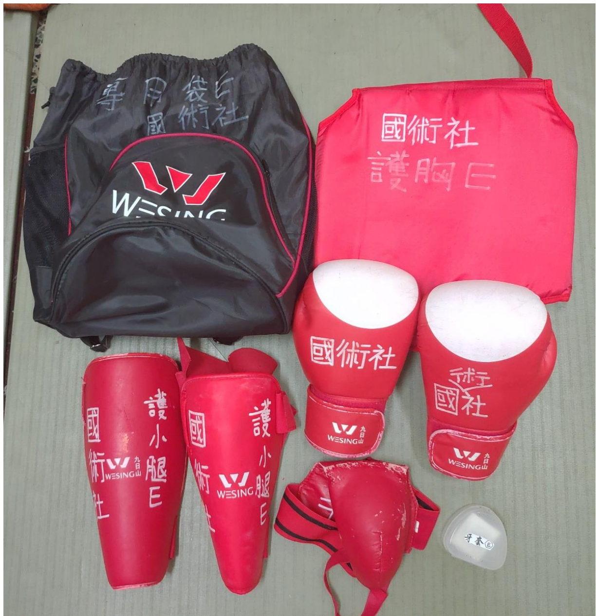
護具E: 專用袋E, 牙套E, 護胸E, 拳套E*2, 護襠E, 護小腿E*2