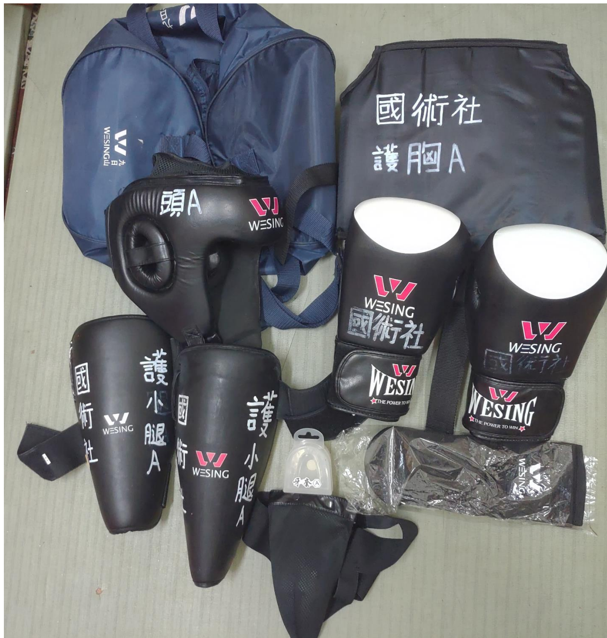
護具A: 專用袋A, 護頭A, 牙套A, 護胸A, 拳套A*2, 護襠A, 護小腿A*2, 護腳背A*2